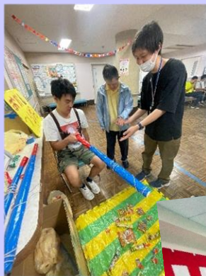
あらいじゅくふくしえん 新井宿福祉園