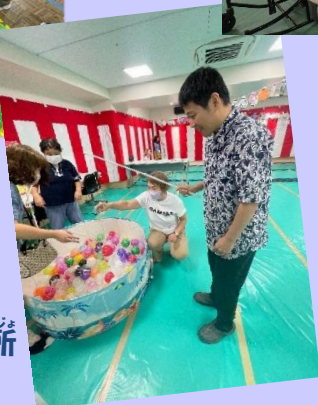
おたせいかつじゅうじょ 大田生活実習所

9月20日、新井宿福祉園、大田 生活実習所、はぎなか園で 3 施設合同による「夏祭り」が開催 されました。