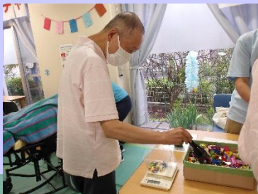
はぎなかえん はぎなか園