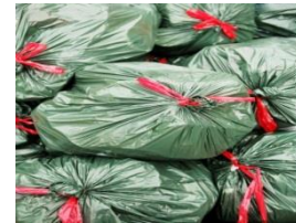
【ごみ落ち葉等分別収集】