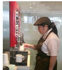
【コーヒーマシンの操作】