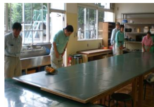
【作業間ミーティング 開始挨拶】【手先を使った集中作業】