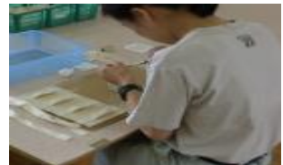
【作業に合わせた補助具】