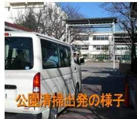
公園清掃出発の様子