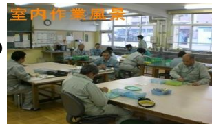
【能力に合わせ人員配置】