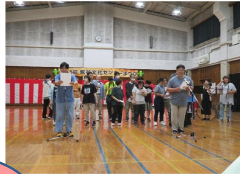
音楽クラブ 「パプリカ」 「さんぽ」