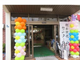
スポーツクラブ 「エビカニクス」