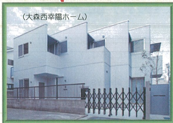
(大森西幸陽ホーム)