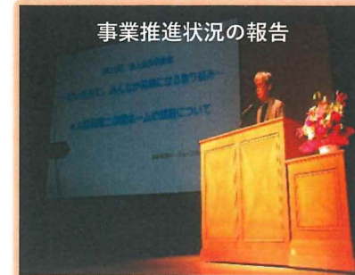
事業推進状況の報告