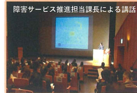
障害サービス推進担当課長による講話