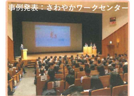
事例発表: さわか工作センター

今年度の研修会は、ご来賓の久保大田区障害福祉サービス推進担当課長の講話からスタートしました。行政の視点からの貴重なお話しを通し、私たちが目指すべき支援の方向性を再確認しました。つづいて専務理事とグループホーム整備担当課長による事業推進状況の報告があり、さわか工作センターの事例発表や事業所トピック紹介では、各事業所が動画やスライドを交えて発表を行いました。職員の働き方や日々の支援、自主生産品や事業所の特徴等、その魅力や特色を紹介し合うことで、互いの理解を深め、法人全体が一丸となってこれからの歩みを進めていくことを確認できた貴重な機会となりました。